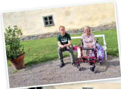
Bilder från Frälsarkrans- vandringen 16 augusti.