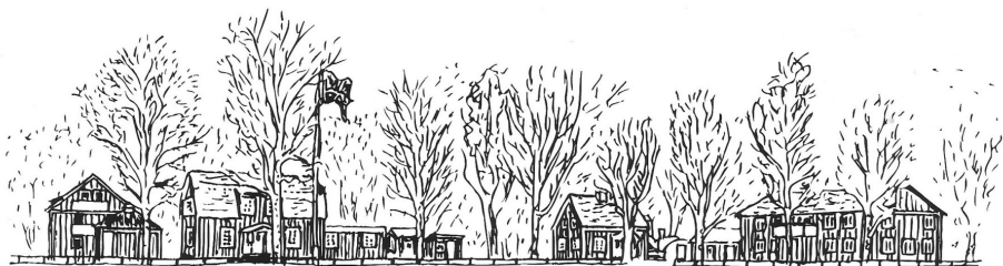
Lyckeby skolan 1994, av Martin Lundström

På 60-talet växte oron i landets församlingar. Man såg att ungdomens rotlöshet ledde till droger, kriminalitet och utslagning, och det fanns få vägar tillbaka för den som kommit snett. ÖD:s svar var Lyckeby-