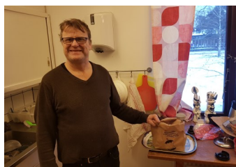
Per har blivit bättre på att sortera!

Vi har haft samtal med Kungsmadsskolan och det är stor chans att de kan hjälpa oss med taket. De kan dock inte ta ner det. Där måste vi anlita en certifierad firma, och detta kostar såklart en slant. All hjälp till detta mottages tacksamt.