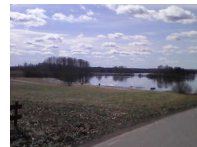
Fläcksjön vid Fläckebo