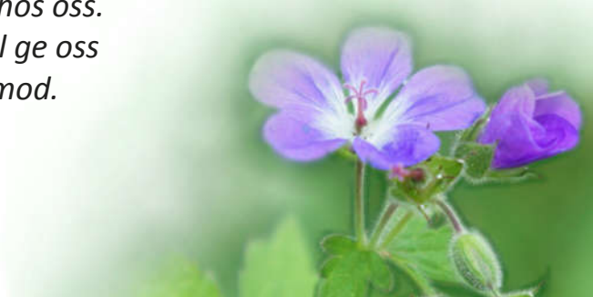
Illustration: Ingegerd Eliasson